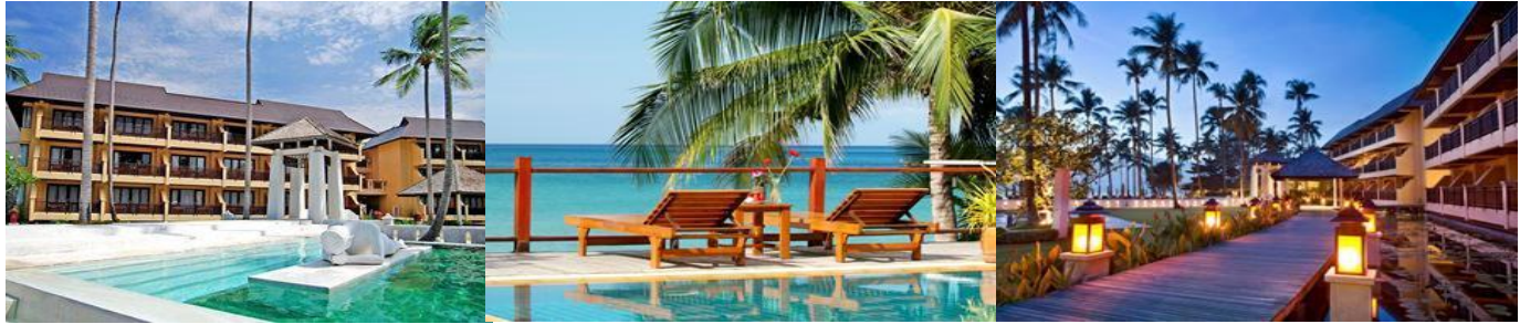
※写真はイメージとなります